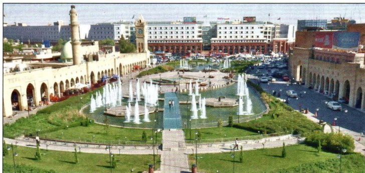
Hewler városa, az iraki Kurdisztánban